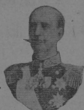
EL REY DE GRECIA a quien ataca rudamente la Prensa francesa

Según los desos de la familia, los funerales de Gainer serán sencillísimos; no dejarán, sin embargo, de ser imponentes. Se ha publicado que asistirán los empleados municipales, la policía, los bomberos, etc.